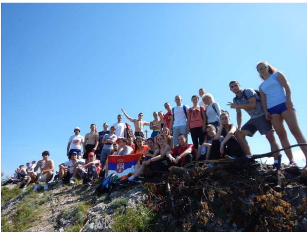
Пешачка тура на планини Копаоник