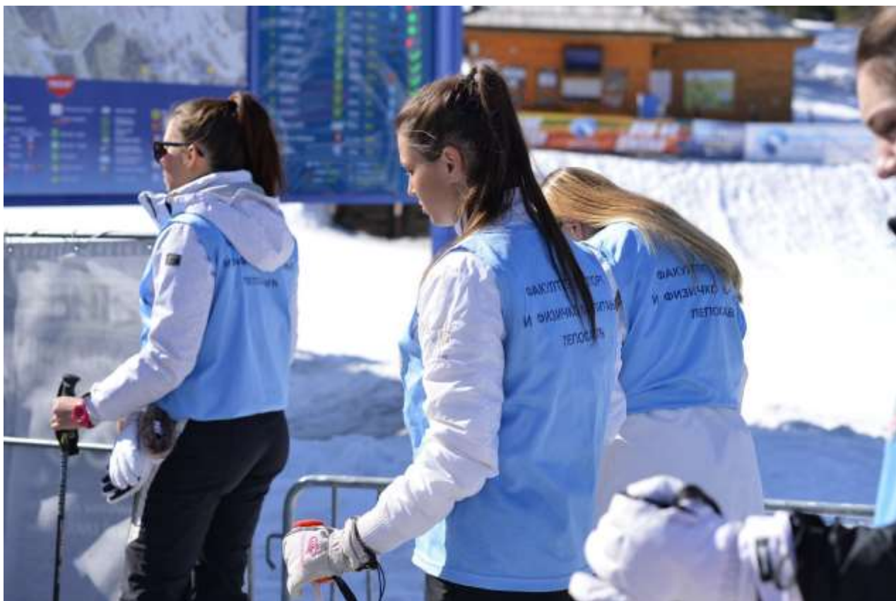
НАСТАВА СКИЈАЊА НА ПЛАНИНИ КОПАОНИК