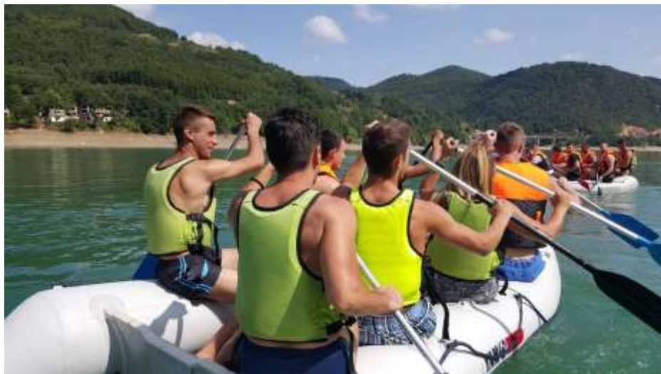
Настава веслања на језеру Газиводе

Рад органа и служби Факултета се периодично испитује кроз активности Комисије за квалитет у складу са Статутом Факултета.